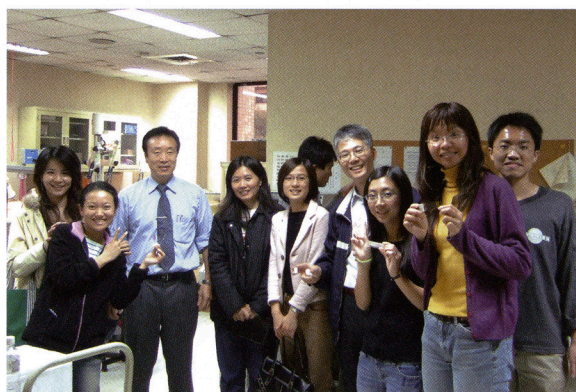
図2. 台湾大学医学部での実習後 受講者たちがうれしそうに自作の「夢の切片」を持っている。

さて、第1日目に戻りますが、実習では、開始後しばらく遠慮気味に私を遠巻きにしていた参加者が、一人始めると次々に切片づくりに挑戦し、16時終了予定が18時過ぎまで続けることになりました。参加者は、初回からきれいな切片を作製することが出来、その切片を自慢そうに大切に持ち帰っていました。この成功に気を良くしたのか、企画担当者から2日目の講演に新しい内容の追加をたのまれ、深夜まで講演原稿の手直しが必