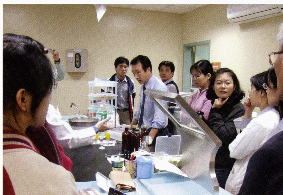
図1. チャングン記念病院での実習を終えてネクタイ姿が筆者

角の機会なので実演しましたところ、その場で台湾での講演が可能か打診され、願ってもないチャンスなので、快諾しました。数日後、8月上旬の講演を依頼してきましたが、準備に2週間ほどしかなく、準備不足の講演は評価を落とすことになると思い、辞退しました。すると10月末に再度、11月13、14、15日に講演と実技指導をお願いしたいとの依頼が届きました。これも準備期間は2週間でしたが、すでに会場等を手配しているとのことなので、覚悟を